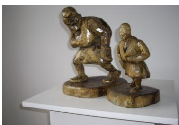
Stor-Nila och Lill-Docka – skulptur i björk 1935 av Thule Lindahl

Och aldrig när hon har varit så intill döden trött.